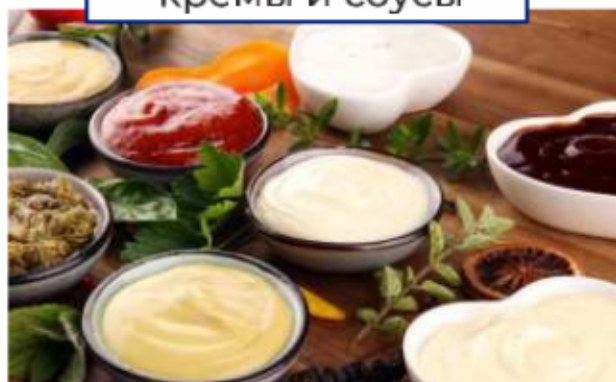
кремы и соусы